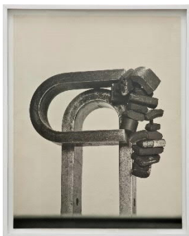
Geta Brătescu_Magnets.jpg Geta Brătescu, Magnets, 1974