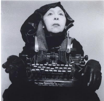
Geta Brătescu_Lady Oliver in Traveling Costume.jpg Geta Brătescu, Lady Oliver in Traveling Costume, 1980

Die Pressebilder stehen auf www.oekultur.at zum Download bereit. Lizenzfreie Nutzung nur unter Angabe des Bildrechts und nur im Rahmen der aktuellen Berichterstattung zur Ausstellung erlaubt.