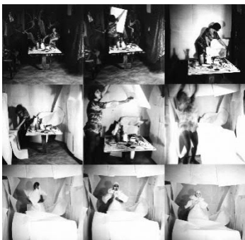
Geta Brătescu_Towards White.jpg Geta Brătescu, Towards White, 1975